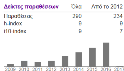
Εικόνα 1. Ετεροαναφορές σύμφωνα με τη μηχανή αναζήτησης Google Citations Scholar (12/1/2017)

Περισσότερες από 290 ετεροαναφορές στο δημοσιευμένο έργο