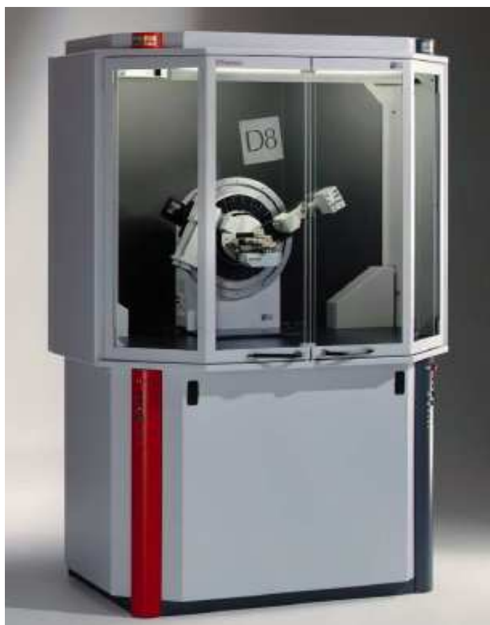
BRUKER D8 FOCUS