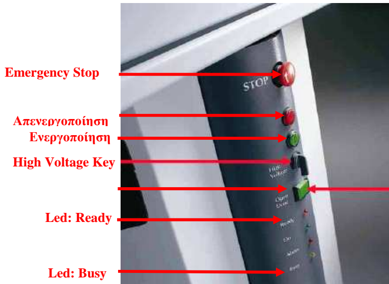
Φωτ. 1: Διακόπτες στο Δεξιό Μέρος της Συσκευής